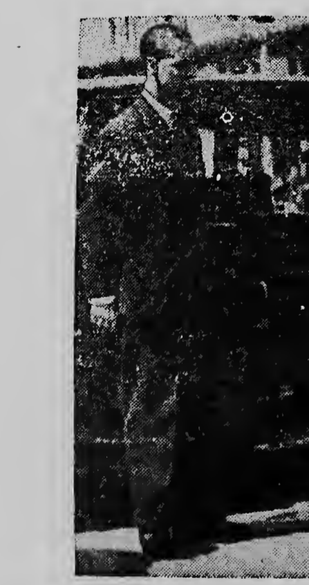
HET KONINKLIJK PAAR van Engeland heeft drukke weken achter de rug. Aan de kroning gingen weken van training vooraf waarbij de Hertogin van Norfolk de plaats van H.M. de Koningin innam. Elizabeth kwam echter vrijwel dagelijks ook persoonlijk om goed voorbereid te zijn voor de plechtigheden, welke door de hele wereld op film, radio en televisie zouden worden meegemaakt. Op de foto wordt zij ontvangen door de Hertog van Norfolk, die als Earl Marjhall van Engeland, belast was met de algemene iedling.

nen, want hij is overtuigd, dat elke chauffeur deze techniek kan leren zonder veel moeite. In Engeland moeten alle chauffeurs van de grote Londense tweeverdiepingsbussen een dergelijke school volgen en een antislip-diploma behalen. Dat zal dus ook in Nederland mogelijk zijn.